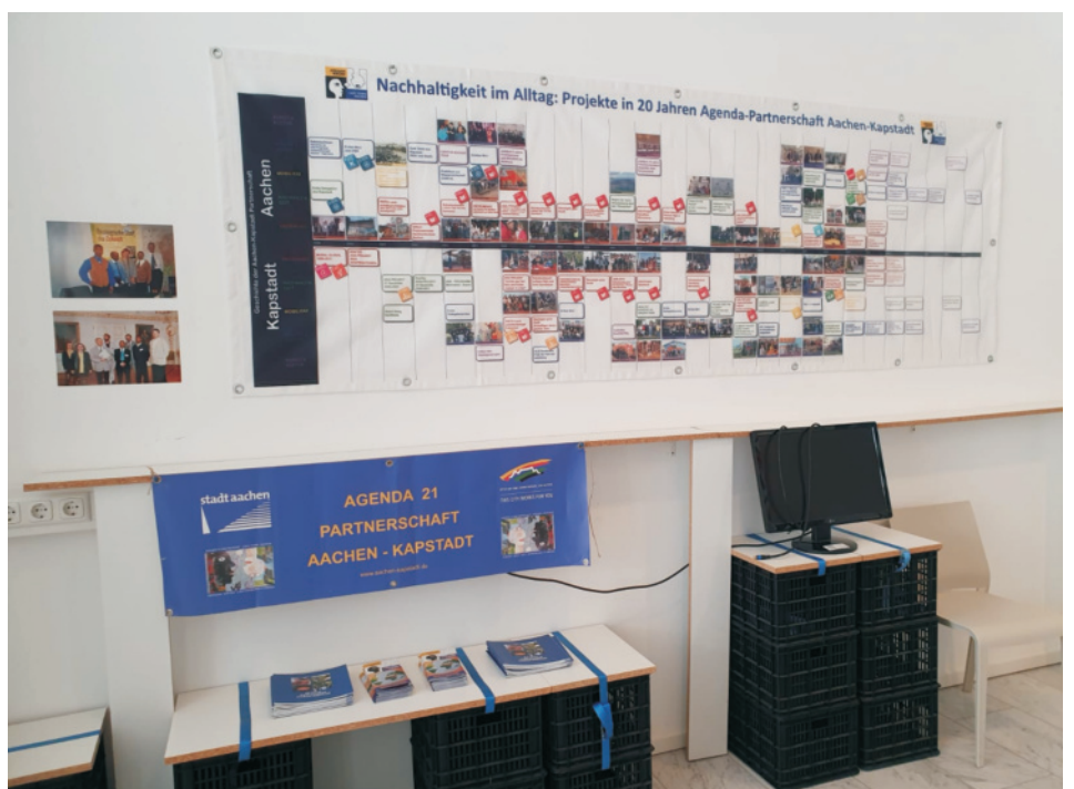
Die TIMELINE - Projekte von 2000 bis 2025