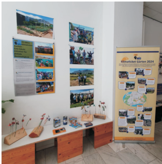
15 Jahre Klimaticket Aachen-Kapstadt