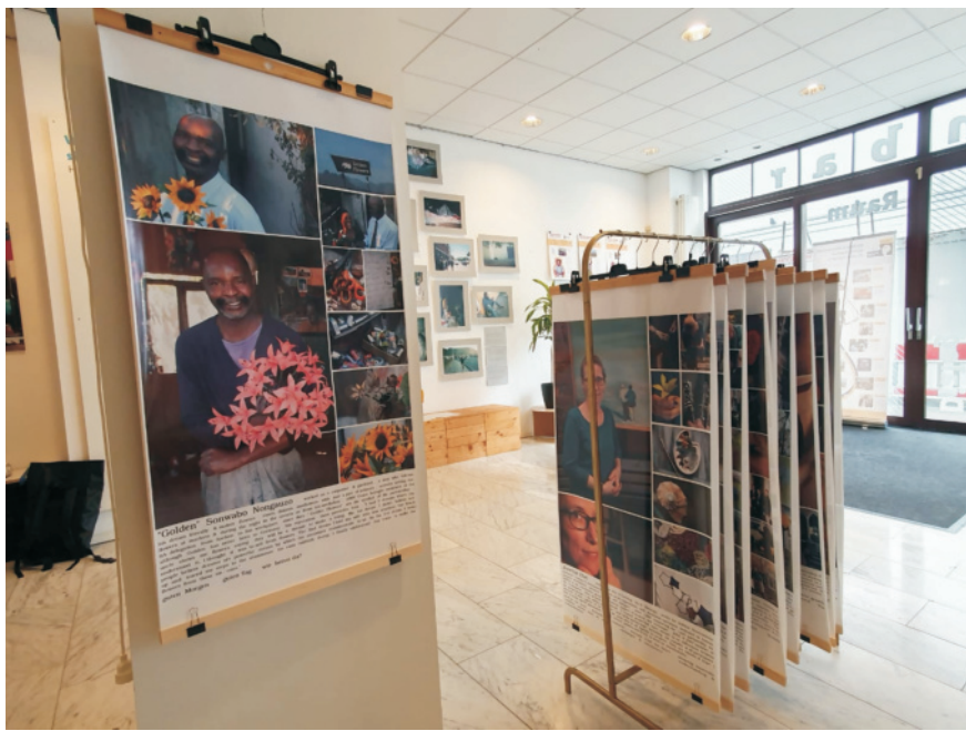
oben: Faces of a Partnership 2010 rechts: 24 Stunden auf der Straße - Das andere Gesicht von Kapstadt