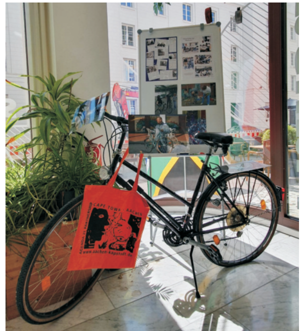
oben: Oberbürgermeisterin Sibylle Keupen und Künstlerin Uta Göbel-Groß vor dem Bunkerbild - rechts: Bicycle-Recycling