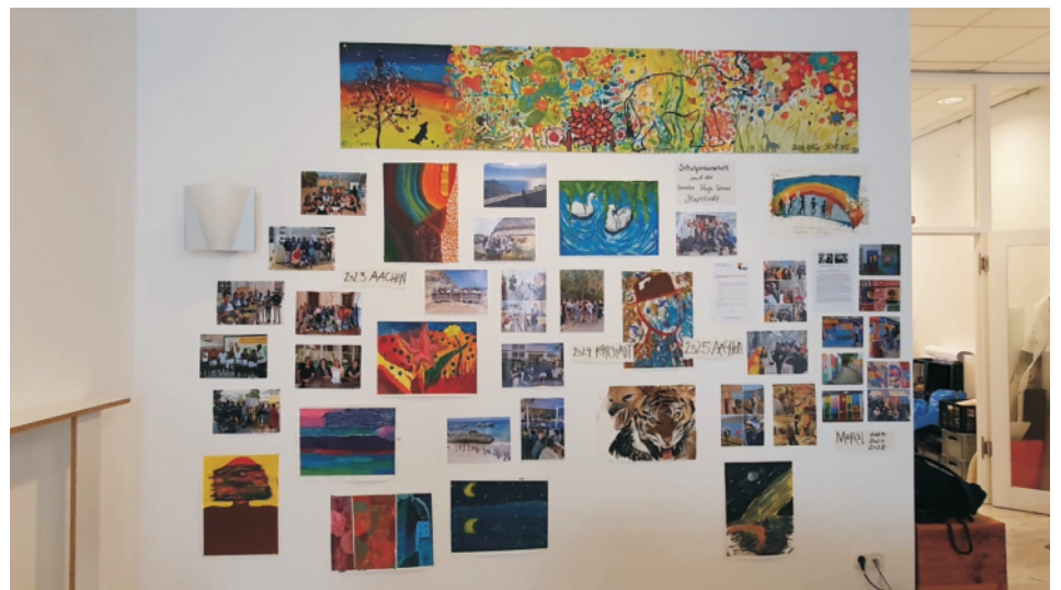
Kunstprojekte beim Schulaustausch Soneike High School - HHG